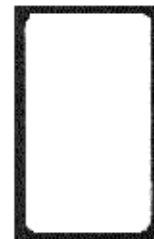
5. völlig beschichtete Oberfläche