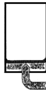
2. Ballastwasser pumpen